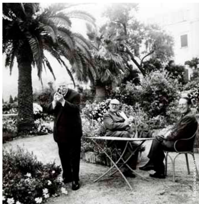
Бех с кинокамера се наслаждава на момент на отмора по време на Конференцията в Месина през 1955 г.

нови стъпки в областта на транспорта и енергетиката, по-специално ядрената, и идеята за създаване на общ пазар, като се обръща специално внимание на необходимостта от общ орган с реални правомощия. Въз основа на опита на Бенелюкс и на Европейската общност за въглища и стомана тримата външни министри предлагат план, развиващ по-нататък идеята на нидерландския министър Байен, който препоръчва икономическото сътрудничество като начин да се постигне обединение на Европа. Този „доклад Спаак“, наречен на името на белгийския министър Спаак, председател на комисията, която го е изготвила, става основа за междуправителствената конференция, на която са изготвени договорите за общ пазар и сътрудничество в областта на атомната енергетика, подписани в Рим на 25 март 1957 г.