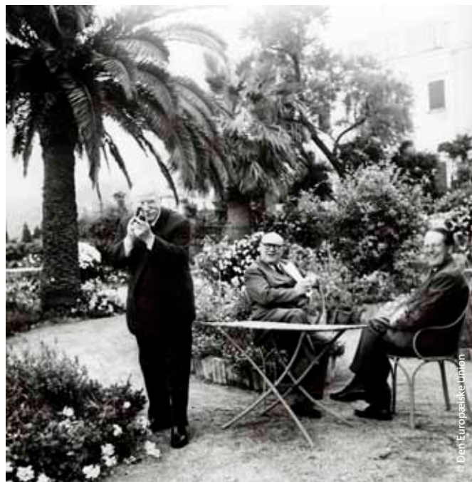
Bech med et filmkamera i et afslappet øjeblik ved Messina-konferencen i 1955.

Efter at have besat posten som udenrigsminister siden 1929 trådte Bech tilbage i 1959. Fra 1959 til 1964 var han formand for parlamentet, indtil han forlod den politiske scene i en alder af 77 år. Han døde 11 år senere i 1975. På grund af hans rolle i foreningen af Europa anser vi ham nu for at være en af grundlæggerne af Den Europæiske Union. Hans virke var et fremragende eksempel på, hvordan et lille land som Luxembourg kan spille en afgørende rolle på den internationale scene.