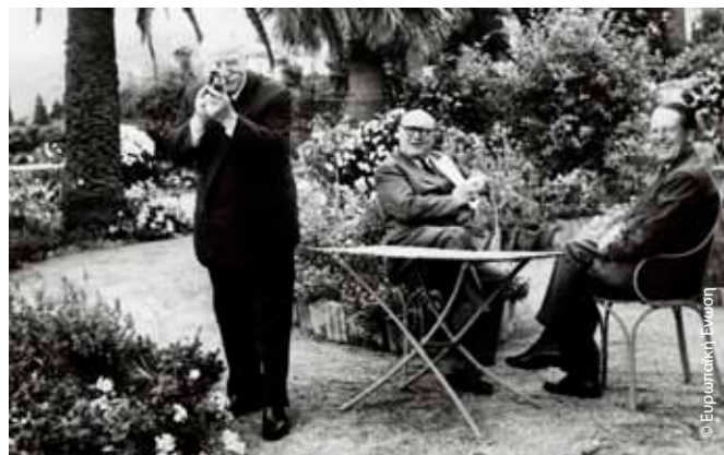
Ο Μπεχ κρατώντας μια μηχανή λήψης απολαμβάνει μια στιγμή χαλάρωσης στη Διάσκεψη της Μεσσήνης το 1955.

Ο Γιόζεφ Μπεχ προήδρευσε της Διάσκεψης της Μεσσήνης (1-3 Ιουνίου 1955), η οποία αργότερα κατέληξε στη Συνθήκη της Ρώμης, την ιδρυτική πράξη της Ευρωπαϊκής Οικονομικής Κοινότητας. Στο επίκεντρο της Διάσκεψης βρισκόταν ένα υπόμνημα που υποβλήθηκε από τις τρεις χώρες της Μπενελούξ, με την υπογραφή μεταξύ άλλων και του Μπεχ ως εκπροσώπου του Λουξεμβούργου. Το υπόμνημα ήταν ένας συνδυασμός γαλλικών και ολλανδικών προτάσεων για την ανάληψη νέων δράσεων στον τομέα των μεταφορών και της ενέργειας, ιδίως της πυρηνικής, καθώς και για τη δημιουργία μιας γενικής Κοινής Αγοράς, με έμφαση στην ανάγκη για μια Κοινή Αρχή με ουσιαστικές αρμοδιότητες. Με βάση την εμπειρία τους από τη Μπενελούξ και την Κοινότητα Άνθρακα και Χάλυβα, οι τρεις υπουργοί Εξωτερικών πρότειναν ένα σχέδιο που ανέπτυξε περαιτέρω την άποψη του Ολλανδού υπουργού Μπέγιεν ότι η οικονομική συνεργασία είναι η οδός που θα οδηγήσει στην ευρωπαϊκή ενοποίηση. Η «έκθεση Σπάακ», όπως είναι γνωστή, από τον Βέλγο υπουργό Σπάακ, πρόεδρο της Επιτροπής που την συνέταξε, αποτέλεσε τη βάση για τη Διακυβερνητική Διάσκεψη στο πλαίσιο της οποίας προέκυψαν οι συνθήκες για την κοινή αγορά και τη συνεργασία στον τομέα της ατομικής ενέργειας, οι οποίες υπογράφηκαν στη Ρώμη στις 25 Μαρτίου 1957.