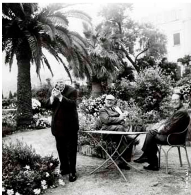
Bech filmikaamera, nautimas puhkehetke 1955. aasta Messina konverentsi ajal.

Olnud oma ametikohal töötanud alates 1929. aastast, loobus Bech 1959. aastal välisministri portfelist. Aastatel 1959–1964 oli ta Luksemburgi Esindajatekoja esimees, enne kui 77 aasta vanusena poliitikast lahkus. Bech suri 11 aastat hiljem, 1975. aastal. Tänu tema tegevusele Euroopa ühendamisel peetakse teda nüüd üheks Euroopa Liidu rajajaks. Bechi näol on tegemist suurepärase näitega sellest, kuidas Luksemburgi-taolisel väikeriigil võib olla rahvusvahelisel areenil otsustav roll.