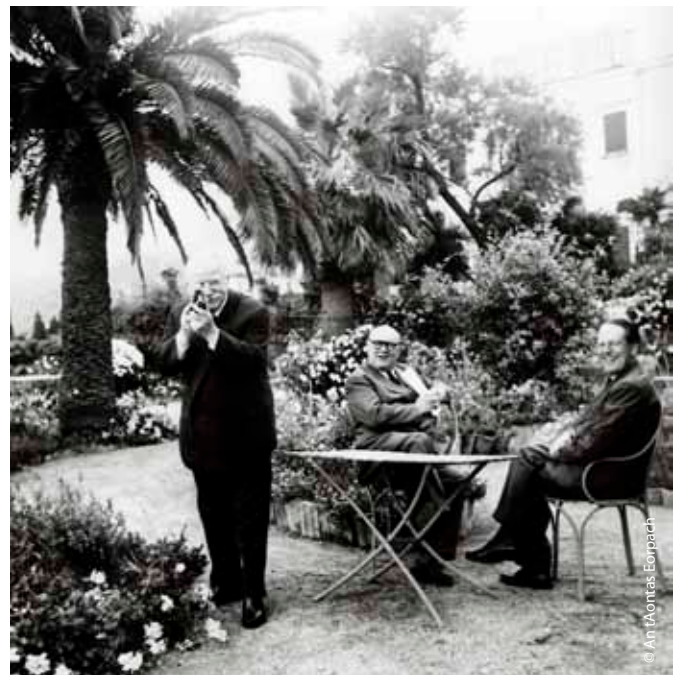
Bech ag spraoi le ceamara físe agus ag ligean a scíth ag Comhdháil Messina i 1955.

ceann Lucsamburg don mheamram sin. Is meascán a bhí sa mheamram idir phleananna na Fraince agus na hÍsiltíre inar thairg siad gníomhaíochtaí nua a dhéanamh sna réimsí iompair agus fuinnimh, go háirithe fuinneamh núicléach, agus Cómhargadh ginearálta, agus díríodh ar an ngá le comhúdarás ag a mbeadh cumhachtaí dáiríre. I bhfianaise na taithí a fuair tíortha Benelux agus an Comhphobal do Ghual agus Cruach, bheartaigh an triúr Airí Gnóthaí Eachtracha ar phlean lena ndéanfaí forbairt bhreise ar an smaoinreamh a bhí ag Aire Beyen na hÍsiltíre, inar moladh comhar eacnamaíoch mar bhealach le haontú na hEorpa a bhaint amach. Tugadh 'Tuarascáil Spaak' air seo mar aitheantas ar Aire Spaak na Beilge, Cathaoirleach an Choiste a dhréachtaigh é, agus bhí an tuarascáil sin ina bhunús leis an gComhdháil Idirrialtasach inar dréachtaíodh na tuarascálacha ar chómhargadh agus ar chomhar i bhfuinneamh adamhach, agus a síníodh sa Róimh an 25 Márta 1957.