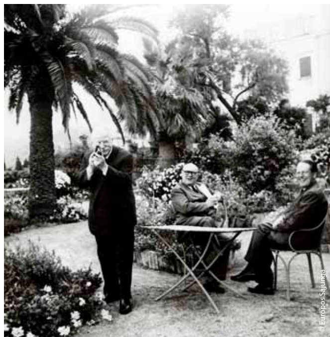
Ž. Bešas su filmavimo aparatu 1955 m. Mesinos konferencijoje mėgaujasi poilsio akimirka.

1959 m. Ž. Bešas atsisakė užsienio reikalų ministro pareigų, kurias ėjo nuo 1929 m. 1959–1964 m. jis pirmininkavo Atstovų Rūmams, o sulaukęs 77 metų pasitraukė iš politinio gyvenimo. Jis mirė po 11 metų – 1975 m. Dėl jo vaidmens vienijant Europą šiandien jį laikome vienu iš Europos Sąjungos steigėjų. Jis įrodė, kad tokia nedidelė šalis kaip Liuksemburgas gali atlikti svarbų vaidmenį tarptautinėje arenoje.