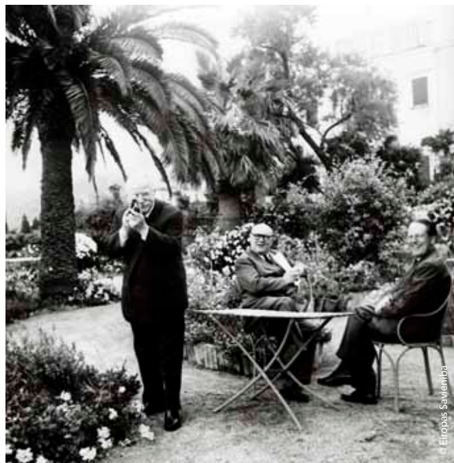
J. Behs ar kinokameru, izbaudot atpūtas brīdi Mesīnas konferencē 1955. gadā.

1959. gadā J. Behs atteicās no ministra portfeļa valsts ārlietās (viņš šo amatu bija ieņēmis kopš 1929. gada). No 1959. līdz 1964. gadam viņš bija priekšsēdētājs Pārstāvju palātā, bet politisko skatuvi pameta 77 gadu vecumā. Viņš nomira pēc 11 gadiem — 1975. gadā. Pateicoties viņa lomai Eiropas apvienošanā, viņu uzskata par vienu no Eiropas Savienības dibinātājiem. Viņš sniedza lielisku piemēru, kā tāda maza valsts kā Luksemburga var spēlēt izšķirošu lomu starptautiskajā arēnā.