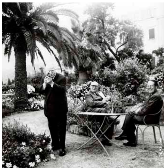
Bech s kamerou vo chvíľach voľna na konferencii v Messine v roku 1955.

V roku 1959 sa Bech po 30 rokoch v úrade vzdal agendy zahraničných vecí. V rokoch 1959 až 1964 predsedal Snemovni reprezentantov a potom vo veku 77 rokov z politiky odišiel. Umrel o 11 rokov neskôr, v roku 1975. Za úlohu, ktorú zohral pri zjednotení Európy, ho dnes považujeme za jedného zo zakladateľov Európskej únie. Dokázal, že aj taká malá krajina ako Luxembursko môže zohrávať významnú úlohu na medzinárodnej scéne.