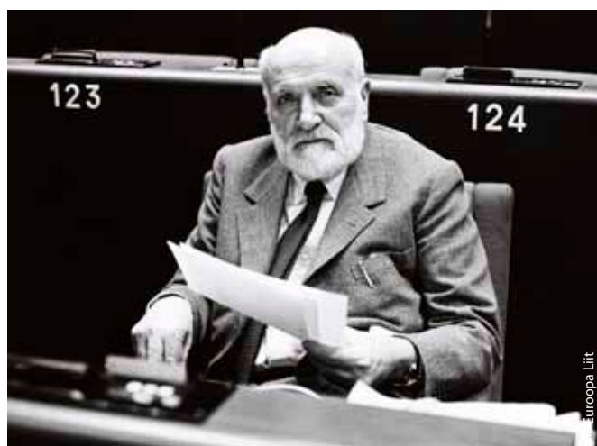
Spinelli Euroopa Parlamendis vahetult pärast tema föderaalset Euroopa plaani vastuvõtmist 1984. aastal.

Kuigi mitte kõiki tema kaugeleulatuvaid ideid ei viidud ellu, töötas Altiero Spinelli järelejätmatus oma eesmärgi nimel saavutada Euroopas riikideülene valitsus, et välistada tulevikus sõda ja liita maailmajao riigid üheks ühendatud Euroopaks. Tema ideedest lähtusid paljud muudatused Euroopa Liidus, eeskätt Euroopa Parlamendi volituste tähelepanuväärne laiendamine. Ja föderalistlik liikumine korraldab tänaseni pisikesel Ventotene saarel korrapäraseid kohtumisi. Altiero Spinelli suri 1986. aastal ning tema järgi on nime saanud Euroopa Parlamendi põhihoone Brüsselis.