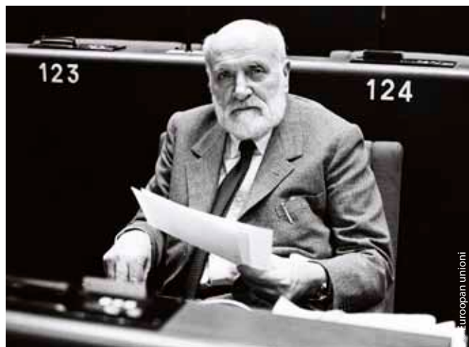
Spinelli Euroopan parlamentissa vuonna 1984 vähän sen jälkeen, kun parlamentti oli hyväksynyt hänen suunnitelmansa Euroopan liittovaltiosta.

Kaikki Altiero Spinellin kunnianhimoiset ehdotukset eivät toteutuneet. Siitä huolimatta hän jaksoi ajaa sinnikkäästi tavoitettaan ylikansallisen hallituksen muodostamisesta Eurooppaan, jotta sotia ei enää syttyisi ja jotta Euroopan maat voisivat yhdistyä yhtenäiseksi Euroopaksi. Altiero Spinellin ajatukset ovat edistäneet monia muutoksia Euroopan unionissa. Yksi niistä on Euroopan parlamentin vallan huomattava lisääminen. Federalistinen liike pitää myös edelleen säännöllisesti kokouksia Ventotenen pikkuruisella saarella. Altiero Spinelli kuoli vuonna 1986. Euroopan parlamentin Brysselin-päärakennus on nimetty hänen mukaansa.