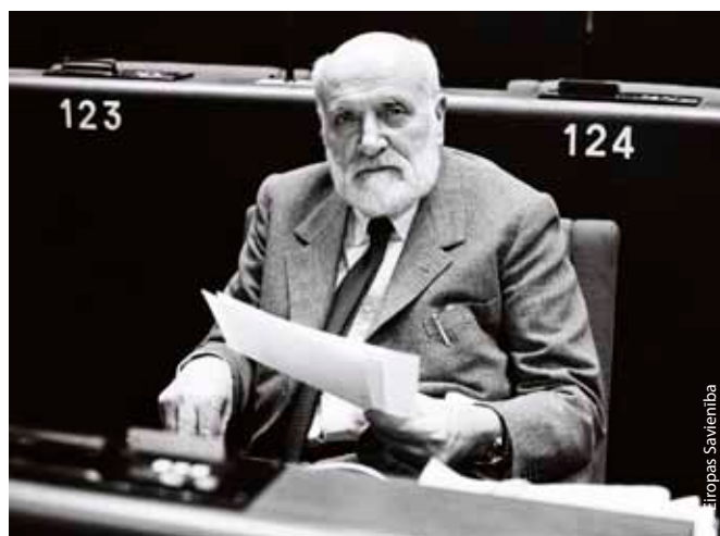
A. Spinelli Eiropas Parlamentā 1984. gadā īsi pēc viņa plāna par federālu Eiropu pieņemšanas.

Kaut arī ne visas no viņa ambiciozajām idejām piepildījās, Altjero Spinelli nenogurstoši sekoja savam mērķim izveidot pārvalstisku Eiropas pārvaldi, kas novērstu karus un apvienotu kontinenta valstis vienotā Eiropā. Viņa uzskati ir iedvesmojuši daudzas izmaiņas Eiropas Savienībā, īpaši palielinot Eiropas Parlamenta pilnvaras. Federālistu kustība vēl joprojām regulāri notur tikšanās nelielajā Ventotenes salā. Altjero Spinelli nomira 1986. gadā, un galvenā Eiropas Parlamenta ēka Briselē ir nosaukta viņa vārdā.