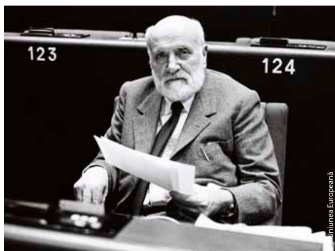
Spinelli în Parlamentul European, la scurt timp după adoptarea planului său pentru o Europă federală în 1984.

Deși nu toate ideile sale ambițioase au devenit realitate, Altiero Spinelli și-a urmărit neîncetat țelul: crearea unui guvern supranațional european pentru a preveni războaiele și pentru ca țările acestui continent să formeze o Europă unită. Gândurile sale au fost sursa de inspirație a multor schimbări în Uniunea Europeană, în special creșterea considerabilă a atribuțiilor Parlamentului European. Mișcarea federalistă organizează și în prezent reuniuni periodice pe mica insulă Ventotene. Altiero Spinelli a murit în 1986, iar clădirea principală a Parlamentului European din Bruxelles îi poartă numele.