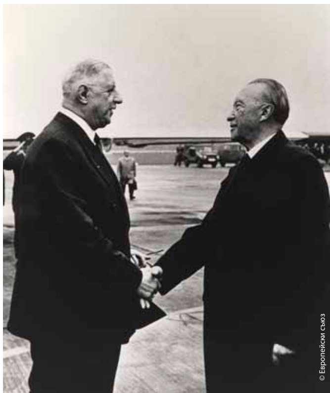
Аденауер се ръкува с Шарл дьо Гол през 1961 г.

След войната Аденауер е възстановен от американците като кмет на Кьолн, но малко по-късно, когато градът става част от британската окупационна зона, е отстранен от поста от англичаните. Това му дава време да се посвети на основаването на Християндемократическия съюз (ХДС), за който той се надява, че ще обедини в една партия протестантите и католиците в Германия. През 1949 г. Аденауер става първият канцлер на Федерална република Германия (Западна Германия). Първоначално се смята, че той ще остане на канцлерския пост за кратко, тъй като по това време вече е на 73 години. Но обратно на очакванията Аденауер (когото наричат „Der Alte“ или „Стареца“) заема поста през следващите 14 години, в резултат на което освен като най-младия кмет на Кьолн, остава в историята и като най-възрастния канцлер на Германия. Под негово ръководство Западна Германия става стабилна демокрация и постига трайно помирение със съседните си страни. Той успява да възстанови известна част от суверенитета на Западна Германия, като интегрира страната с възникващата евроатлантическа общност (НАТО и Организацията за европейско икономическо сътрудничество).