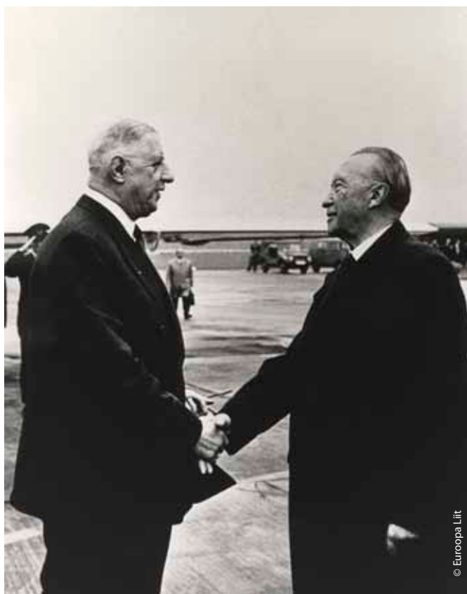
Adenauer kätlemas Charles de Gaulle'iga 1961. aastal.

pühenduda Kristlik-Demokraatliku Liidu (CDU) ülesehitamisele, millega ta lootis koondada ühte parteisse nii protestantidest kui ka katoliiklastest sakslased. 1949. aastal sai temast Saksamaa Liitvabariigi (Lääne-Saksamaa) esimene kantsler. Algselt arvati, et Adenauer tegutseb kantslerina vaid lühikest aega, sest selleks ajaks oli ta juba 73-aastane. Sellele vaatamata püsis Adenauer (kellele anti hüüdnimi Der Alte ehk Vanem) sel ametikohal järgmised 14 aastat; seega ei ole ta mitte ainult läbi aegade noorim Kölni linnapea, vaid ka vanim Saksamaa kantsler. Tema juhtimisel sai Lääne-Saksamaast stabiilne demokraatia ning saavutati püsiv lepitus naaberriikidega. Samuti õnnestus tal teataval määral taastada Lääne-Saksamaa suveräänsus, lõimides riigi väljakujuneva Euro-Atlandi kogukonnaga (NATO ning Euroopa Majanduskoostöö Organisatsiooniga).