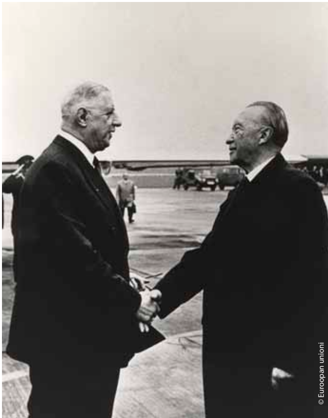
Adenauer kättelemässä Charles de Gaullea vuonna 1961.

Sodan jälkeen amerikkalaiset nimittivät Adenauerin uudelleen Kölnin pormestariksi. Britit kuitenkin syrjäyttivät hänet nopeasti, kun Kölnistä tuli Britannian miehitysvyöhyke. Tämä antoi Adenauerille mahdollisuuden keskittää voimansa Kristillisdemokraattisen unionin (CDU) perustamiseen. Adenauer toivoi Saksan protestanttien ja katolilaisten yhdistyvän yhdeksi puolueeksi. Vuonna 1949 Konrad Adenauerista tuli Saksan liittotasavallan (Länsi-Saksan) ensimmäinen liittokansleri. Alun perin ajateltiin, että Adenauer toimisi liittokanslerina vain lyhyen aikaa, koska hän oli jo 73-vuotias. Adenauer (joka tunnettiin lempinimellä "Der Alte", "vanhus") pysyi kuitenkin tehtävässään 14 vuotta. Näin ollen Adenauer on sekä kaikkien aikojen nuorin Kölnin pormestari että kaikkien aikojen vanhin Saksan liittokansleri. Adenauerin kanslerikaudella Länsi-Saksasta tuli vakaa demokratia, joka teki pysyvän sovinnon naapurimaidensa kanssa. Adenauer onnistui palauttamaan osan Länsi-Saksan vaikutusvallasta, kun maa liittyi perusteilla oleviin euroatlanttisiin yhteisöihin (Natoon ja Euroopan taloudellisen yhteistoiminnan järjestöön).