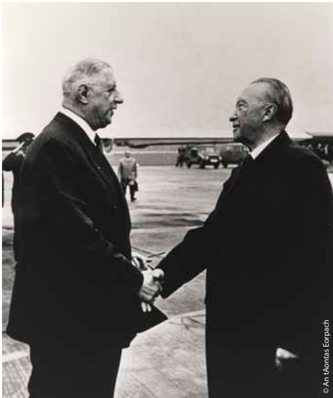
Adenauer ag croitheadh lámhe le Charles de Gaulle i 1961.

ama do Adenauer chun díriú ar bhunú an Aontais Dhaonlathaigh Críostaí (CDU) agus bhí súil aige go n-aontófaí Protastúnaigh agus Caitlicigh na Gearmáine in aon pháirtí amháin. I 1949, ceapadh ina chéad Seansailéir ar Phoblacht Chónaidhme na Gearmáine (An Ghearmáin Thiar) é. Ba é an tuiscint a bhí ann i dtosach nach mbeadh Adenauer ina Sheansailéir ar feadh i bhfad agus é in aois 73 bliain an tráth sin. Ainneoin sin, bhí an post i seilbh Adenauer (ar tugadh 'Der Alte' nó 'An Seanóir' air mar leasainm) go ceann 14 bliain, agus ní amháin go raibh sé ar an méara ab óige ar Köln ach tá sé ar an Seansailéir is sine a bhí sa Ghearmáin riamh. Faoi stiúir Adenauer, rinneadh daonlathas buanseasmhach den Ghearmáin Thiar agus d'éirigh léi athmhuintearas buan a dhéanamh leis na tíortha comharsanacha. D'éirigh leis roinnt ceannasachta a fháil ar ais don Ghearmáin Thiar tríd an tír a lánpháirtiú sa chomhphobal Eora-Atlantach a bhí ag teacht chun cinn (ECAT agus an Eagraíocht um Chomhar Eacnamaíochta san Eoraip).