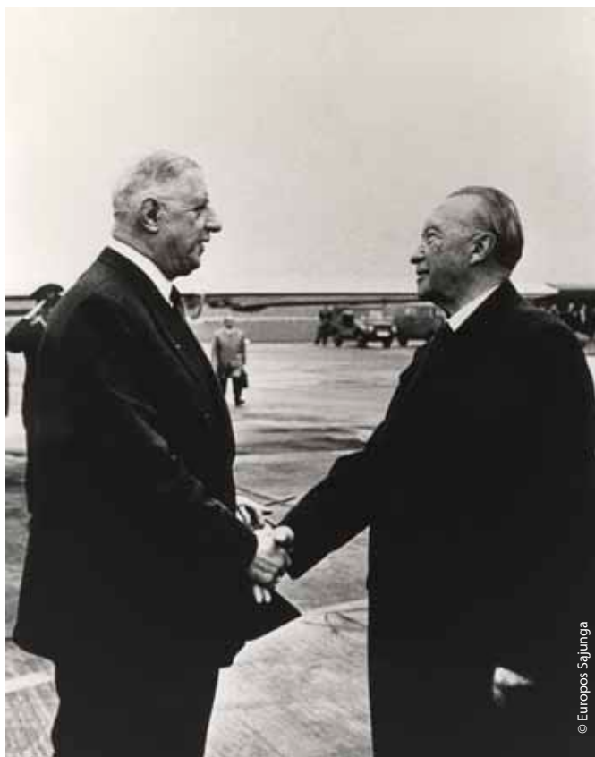
K. Adenaueris 1961 m. spaudžia ranką Šarliui de Goliui

Po karo amerikiečiai grąžino K. Adenauerį į Kelno mero pareigas, bet Kelną perdavus britų okupacinei zonai britai netrukus pašalino jį iš jį. Taip K. Adenaueriui atsirado laiko atsidėti Krikščionių demokratų sąjungos (CDU), kurioje jis tikėjosi suvienyti vokiečius protestantus ir katalikus į vieną partiją, kūrimui. 1949 m. jis tapo pirmuoju Vokietijos Federacinės Respublikos (Vakarų Vokietijos) kancleriu. Iš pradžių manyta, kad K. Adenaueris kanclerio pareigas eis trumpai, nes jam tuo metu jau buvo 73 metai. Tačiau, nepaisant šios nuomonės, K. Adenaueris (pramintas Der Alte, t. y. seniu) šias pareigas ėjo dar 14 metų, taigi buvo ne tik jausias visų laikų Kelno meras, bet ir seniausias kancleris, kada nors vadovavęs Vokietijai. Jo vadovaujama Vakarų Vokietija tapo stabilia demokratine valstybe ir įtvirtino taikūs santykius su kaimyninėmis šalimis. Jam pavyko integruoti šalį į besiformuojančią euroatlantinę bendriją (NATO ir Europos ekonominio bendradarbiavimo organizaciją) ir taip atgauti tam tikrą Vakarų Vokietijos suverenitetą.