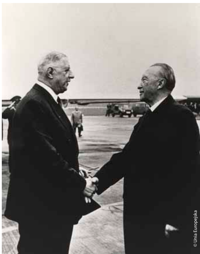
Uścisk dłoni Adenauera i Charles'a de Gaulle'a w 1961 roku

Brytyjczyków, gdy Kolonia znalazła się w granicach brytyjskiej strefy okupacyjnej. Adenauer mógł odtąd poświęcić swój czas na zakładanie Unii Chrześcijańsko-Demokratycznej (CDU), która – jak liczył – miała zjednoczyć w swoich szeregach niemieckich protestantów i katolików. W 1949 roku Adenauer został pierwszym kanclerzem Republiki Federalnej Niemiec (Niemiec Zachodnich). Początkowo myślano, że Adenauer będzie kanclerzem tylko przez krótki czas, zważywszy, że miał już wtedy 73 lata. Wbrew temu przekonaniu Adenauer (zwany „Der Alte”, czyli „Starym”) zajmował jednak to stanowisko przez kolejnych 14 lat, przez co stał się nie tylko najmłodszym w historii burmistrzem Kolonii, lecz także najstarszym kanclerzem, jaki kiedykolwiek stał na czele Niemiec. Pod przywództwem Adenauera Niemcy Zachodnie stały się stabilną demokracją i trwale pojednały się ze swoimi sąsiadami. Adenauer zdołał przywrócić pewną suwerenność Niemcom Zachodnim, wprowadzając kraj do powstającej wspólnoty euroatlantyckiej (NATO i Organizacji Europejskiej Współpracy Gospodarczej).