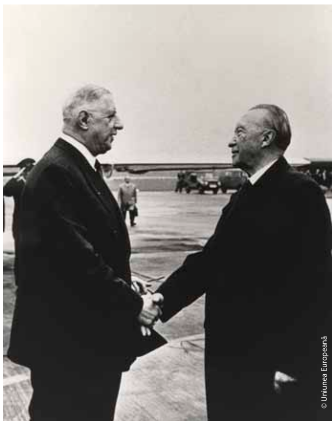
Adenauer dând mâna cu Charles de Gaulle în 1961.

După război, Adenauer a fost repus în funcția de primar al orașului Köln de către americani, dar a fost îndepărtat la scurt timp de către britanici, când orașul a fost transferat în zona de ocupație britanică. Astfel, Adenauer a avut timp să se dedice înființării Uniunii Creștin-Democrate (UCD), prin care a sperat să unifice germanii protestanți și catolici într-un singur partid. În 1949, a devenit primul cancelar al Republicii Federale Germania (Germania de Vest). Inițial, s-a crezut că Adenauer va fi cancelar doar pentru o perioadă scurtă de timp, având în vedere că avea deja 73 de ani la acea vreme. Cu toate acestea, în ciuda părerii generale, Adenauer (supranumit „Der Alte”, sau „Bătrânul”) a continuat să ocupe această funcție în următorii 14 ani, devenind astfel nu numai cel mai tânăr primar al orașului Köln, ci și cel mai în vârstă cancelar pe care l-a avut Germania vreodată. Sub conducerea sa, Germania de Vest a devenit o democrație stabilă și a ajuns la o reconciliere de durată cu țările vecine. Cancelarul a reușit să recapete o parte din suveranitate pentru Germania de Vest prin integrarea țării în comunitatea euro-atlantică, aflată în curs de dezvoltare (NATO și Organizația pentru Cooperare Economică Europeană).