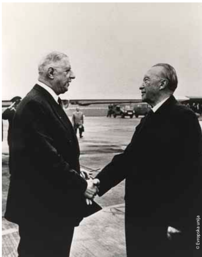
Konrad Adenauer in Charles de Gaulle, 1961.

Američani so Adenauerja po vojni ponovno postavili na položaj župana Kölna, vendar so ga kmalu spet odstavili Britanci, ko je Köln postal del britanske zasedbene cone. Adenauer se je tako lahko popolnoma posvetil ustanovitvi Krščansko-demokratske unije (CDU), za katero je upal, da bo v eni stranki združila protestantske in katoliške Nemce. Leta 1949 je postal prvi kancler Zvezne republike Nemčije (Zahodne Nemčije). Sprva je kazalo, da bo Adenauer kancler le kratek čas, saj je imel takrat že 73 let. Vendar je Adenauer (ki so ga klicali „Der Alte“ ali „starosta“) na tem položaju ostal kar 14 let, tako da ni bil le najmlajši župan Kölna, ampak tudi najstarejši kancler Nemčije v njeni zgodovini. Pod njegovim vodstvom je Zahodna Nemčija postala trdna demokracija in dosegla trajno spravo s sosednjimi državami. Uspelo mu je obnoviti določeno stopnjo suverenosti Zahodne Nemčije, tako da jo je povezal z nastajajočo evro-atlantsko skupnostjo (NATO in Organizacijo za evropsko gospodarsko sodelovanje).