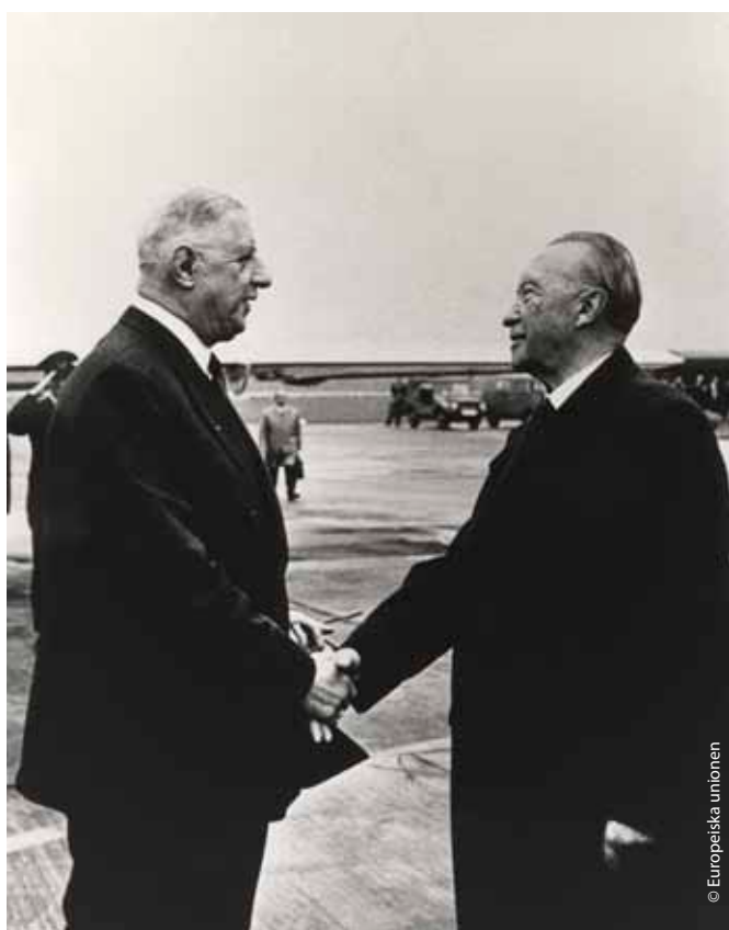
Konrad Adenauer skakar hand med Charles de Gaulle 1961.

tid att starta Kristdemokratiska unionen (CDU), som han hoppades skulle kunna ena tyska protestanter och katoliker i ett enda parti. 1949 blev han den första kanslern i Förbundsrepubliken Tyskland (Västtyskland). Till en början trodde man att Adenauer bara skulle vara kansler en kort tid, eftersom han redan var 73 år gammal. Men Adenauer (som kallades "der Alte" eller "gamlingen") satt på posten i 14 år, vilket gör honom till Tysklands äldsta kansler hittills. Han var dessutom den yngsta borgmästaren någonsin i Köln. Under hans ledarskap blev Västtyskland en stabil demokrati som försonades med sina grannländer. Han lyckades återfå en viss suveränitet för Västtyskland genom att låta landet ingå i den framväxande euroatlantiska gemenskapen (NATO och Organisationen för europeiskt ekonomiskt samarbete).