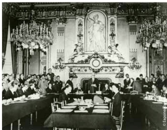
Шуман произнася известната си реч на 9 май 1950 г. – в деня, който днес се отбелязва като рожден ден на ЕС.

Речта му не остава без отзвук и германският канцлер Аденауер реагира бързо с положителен отговор, както правят и правителствата на Нидерландия, Белгия, Италия и Люксембург. Една година по-късно, на 18 април 1951 г. шестте държави-учредители подписват Парижкия договор. С него се основава Европейската общност за въглища и стомана – първата наднационална общност в Европа. Тази първа по рода си организация проправя пътя за Европейската икономическа общност и впоследствие за Европейския съюз, който все още се ръководи от новаторските институции, замислени през 1950 г.