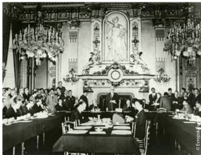
Schuman při svém slavném projevu dne 9. května roku 1950, který se slaví jako den vzniku Evropské unie.

Zde však Schumanovo úsilí neskončilo. Byl velkým zastáncem dalšího sjednocování prostřednictvím Evropského obranného společenství a v roce 1958 se stal prvním předsedou předchůdce současného Evropského parlamentu. Když funkci opustil, parlament mu udělil titul „otec Evropy“. Vzhledem k významu Schumanovy deklarace přednesené dne 9. května roku 1950 byl tento den vyhlášen „Dnem Evropy“ a na počest Schumanovy průkopnické práce v oblasti evropské integrace nese jeho jméno bruselská čtvrť, kde sídlí ústředí několika evropských institucí.