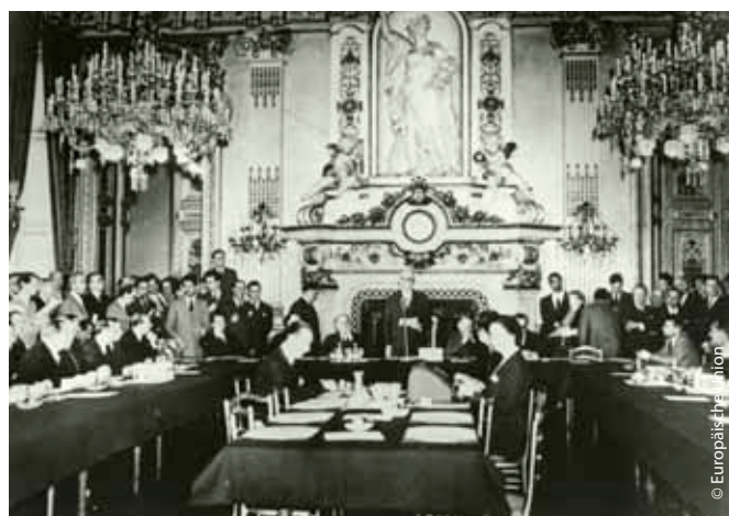
Schuman hält seine berühmte Rede vom 9. Mai 1950, dem Tag, der heute als Geburtsstunde der EU gefeiert wird.

Seine Ansprache stieß nicht auf taube Ohren – sowohl vom deutschen Bundeskanzler Adenauer als auch von den Regierungen der Niederlande, Belgiens, Italiens und Luxemburgs kam rasch eine positive Antwort. Innerhalb eines Jahres, am 18. April 1951, unterzeichneten die sechs Gründungsmitglieder den Pariser Vertrag. Dadurch wurde die Europäische Gemeinschaft für Kohle und Stahl gegründet, Europas erste supranationale Gemeinschaft. Diese richtungweisende Organisation ebnete den Weg für die Europäische Wirtschaftsgemeinschaft und schließlich für die Europäische Union, deren Geschicke noch immer von innovativen europäischen Institutionen gelenkt werden, wie sie 1950 erdacht wurden.