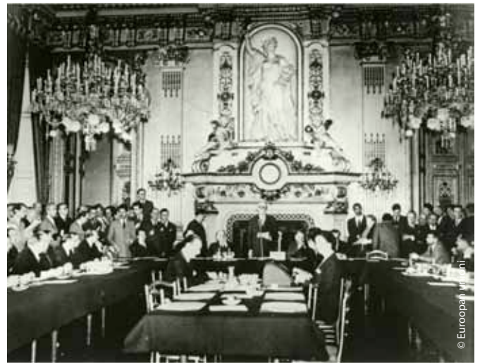
Schuman pitämässä kuulua puhettaan 9. toukokuuta 1950. Tätä päivää juhliitaan nykyään EU:n syntymäpäivänä.

Schumanin puhe ei kaikunut kuuroille korville, sillä Saksan liittokansleri Konrad Adenauer hyväksyi ehdotuksen nopeasti. Samoin tekivät Alankomaiden, Belgian, Italian ja Luxemburgin hallitukset. Alle vuoden päästä julistuksen antamisesta, 18. huhtikuuta 1951, kuusi perustajajäsentä allekirjoittivat Pariisin sopimuksen. Sopimuksella perustettiin Euroopan hiili- ja teräsyhteisö, Euroopan ensimmäinen ylikansallinen yhteisö. Tämä uraauurtava järjestö viitoitti tietä Euroopan talousyhteisön ja sittemmin Euroopan unionin perustamiselle. Euroopan unionin nykyisten toimielinten perusrakenne on edelleen samankaltainen kuin vuonna 1950.