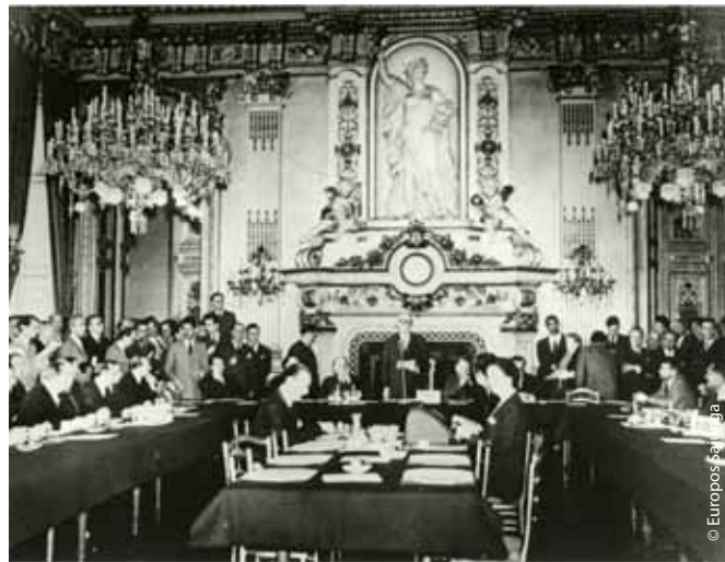
R. Šumanas 1950 m. gegužės 9 d., kuri šiandien švenčiama kaip ES gimimo diena, sako savo garsiąją kalbą.

Tačiau jo pastangos tuo neapsiribojo. Jis tapo dideliu tolesnės integracijos – Europos gynybos bendrijos steigimo – šalininku, o 1958 m. – pirmuoju institucijos, dabartinio Europos Parlamento pirmtakės, pirmininku. Kai pasitraukė iš tarnybos, Parlamentas jam suteikė „Europos tėvo“ vardą. Dėl 1950 m. gegužės 9 d. Šumano deklaracijos svarbos ši diena tapo Europos diena. Novatoriškas jo darbas siekiant Europos vienybės pagerbtas – jo vardu pavadintas Briuselio kvartalas, kuriame yra kelių Europos Sąjungos institucijų būstinės.