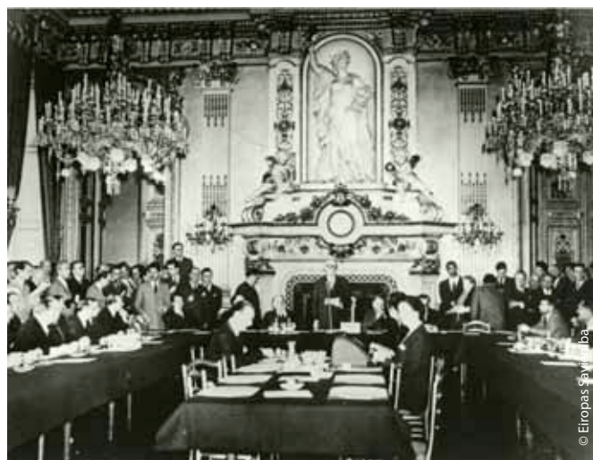
R. Šūmans uzstājās ar savu slaveno runu 1950. gada 9. maijā, kas tagad tiek svinēta kā ES dzimšanas diena.

Tomēr viņa centieni ar to nebeidzās. R. Šūmans iestājās par vēl lielāku integrāciju un atbalstīja Eiropas Aizsardzības kopienas ieceri, bet 1958. gadā viņš kļuva par pirmo priekšsēdētāju iestādē, kas bija pašreizējā Eiropas Parlamenta priekštece. Kad viņš aizgāja no šī amata, Parlaments viņam piešķīra titulu “Eiropas dibinātājs”. Pateicoties 1950. gada 9. maija Šūmana deklarācijas milzīgajai nozīmei, šī diena tiek atzīmēta kā “Eiropas diena”. Un, godinot viņa celmlauža darbu Eiropas vienotības panākšanā, vairāku Eiropas Savienības iestāžu galveno administrācijas ēku rajons Briselē ir nosaukts viņa vārdā.