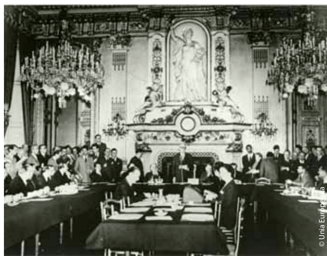
Schuman wygłaszający swoją słynną przemowę 9 maja 1950 r. Data ta jest obecnie uważana za dzień narodzin UE.

Jego słowa nie trafiły w próżnię. Reakcja niemieckiego kanclerza, Konrada Adenauera, była szybka i pozytywna, podobnie jak reakcja rządów Holandii, Belgii, Włoch i Luksemburga. Zaledwie po roku, 18 kwietnia 1951 r., sześć państw założycielskich podpisało traktat paryski. Na jego mocy utworzono pierwszą ponadnarodową wspólnotę europejską – Europejską Wspólnotę Węgla i Stali. Powołanie tej przełomowej organizacji uutorowało drogę dla utworzenia Europejskiej Wspólnoty Gospodarczej i Unii Europejskiej, którą nadal kieruje ten sam rodzaj nowatorskich instytucji europejskich, jakie zapoczątkowano w 1950 r.