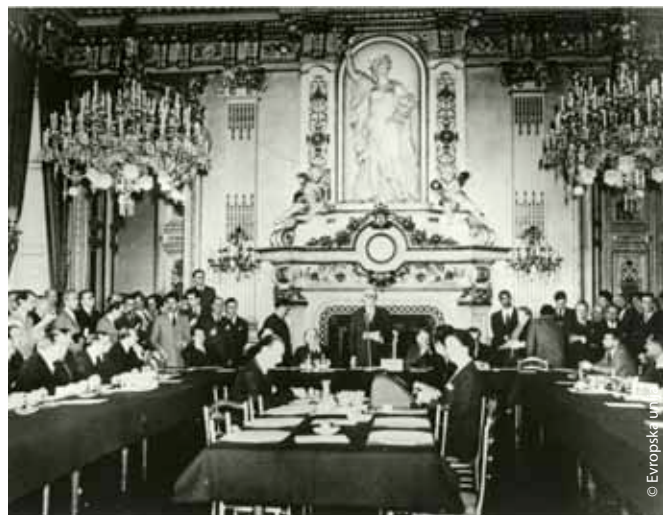
Robert Schuman med svojim znamenitim govorom 9. maja 1950 – dan, ki ga danes praznujemo kot rojstvo EU.

Vendar se Schumanovo delo s tem ni končalo. Bil je glavni pobudnik nadaljnega povezovanja v okviru Evropske obrambne skupnosti, leta 1958 pa je postal prvi predsednik institucije, ki je bila predhodnica Evropskega parlamenta. Ob koncu mandata mu je parlament podelil naziv „oče Evrope“. Zaradi pomembnosti Schumanove deklaracije z dne 9. maja 1950 so ta dan razglasili za dan Evrope. V počastitev njegovega pionirskega dela v združevanju Evrope so po njem poimenovali bruseljsko četrt, v kateri ima sedež več institucij Evropske unije.