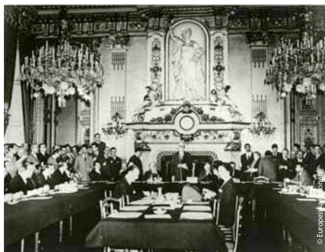
Schuman håller sitt berömda tal den 9 maj 1950, den dag som nu firas som EU:s födelsedag.

Men Schuman gjorde mer än så. Han blev en varm anhängare av fördjupad integration genom en europeisk försvarsgemenskap och 1958 blev han den förste talmannen i föregångaren till dagens Europaparlament. När han lämnade sin post gav parlamentet honom titeln "Europas fader". På grund av innebörden av Schumandeklarationen den 9 maj 1950 har denna dag utsetts till Europadagen. Och för att hedra Schumans pionjärbete har Brysselkvarteret där flera EU-institutioner har sina högkvarter fått hans namn.