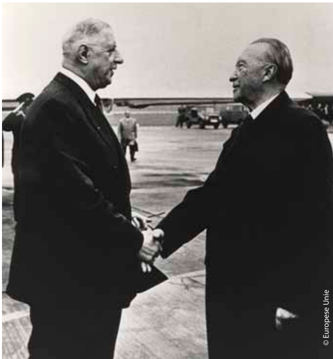
Adenauer die in 1961 de handen schudt met Charles de Gaulle.

Na de bezetting benoemden de Amerikanen Adenauer tot burgemeester van Keulen, maar de Britten maakten dat besluit korte tijd later ongedaan toen Keulen onder de Britse bezettingszone viel. Dat gaf Adenauer de tijd om zich actief bezig te houden met de oprichting van de Christelijk-Democratische Unie (CDU). Hij hoopte hiermee protestantse en katholieke Duitsers in één partij te verenigen. In 1949 werd hij de eerste kanselier van de Bondsrepubliek Duitsland (West-Duitsland). Aanvankelijk werd gedacht dat Adenauer niet lang kanselier zou zijn, omdat hij toen al 73 jaar was. Desondanks bekleedde Adenauer (die de bijnaam "Der Alte", of "de oudere" had) deze functie nog gedurende 14 jaar. Hierdoor was hij niet alleen de jongste burgemeester van Keulen ooit, maar ook de oudste kanselier die Duitsland ooit had gekend. Onder zijn leiding werd West-Duitsland een stabiele democratie en bereikte het een duurzame verzoening met zijn buurlanden. Hij slaagde erin enige soevereiniteit voor West-Duitsland terug te winnen door het land te integreren in de opkomende Euro-Atlantische gemeenschap (NAVO en de Organisatie voor Europese Economische Samenwerking).