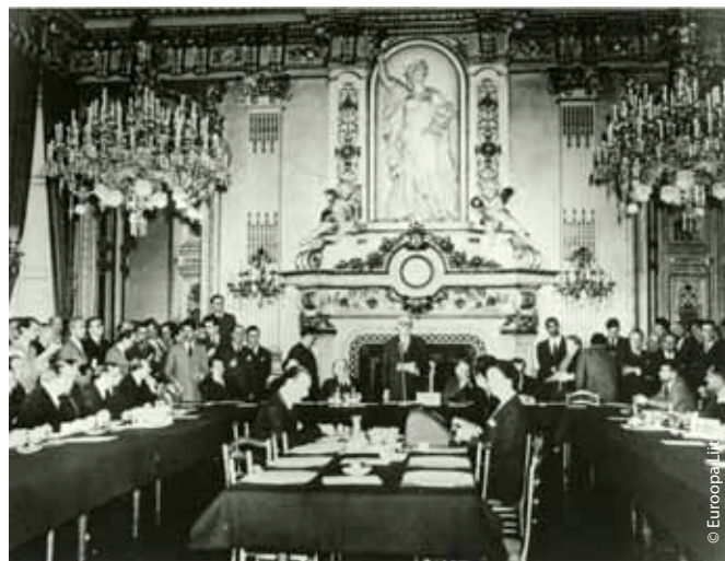
Schuman pidamas oma kuulsat kõnet 9. mail 1950 – päeval, mida nüüd tähistatakse ELi sünnipäevana.

Sellega Schumani tegevus aga ei piirdunud. Ta pooldas jõuliselt veelgi suuremat lõimumist Euroopa Kaitseühenduse kaudu ning 1958. aastal sai temast praeguse Euroopa Parlamendi eelkäija esimene president. Ametist lahkudes andis parlament Schumanile tiitli Euroopa isa. 9. mail 1950 avaldatud Schumani deklaratsiooni peetakse nii tähtsaks, et see päev on nimetatud Euroopa päevaks. Ja tunnustamaks Schumani teedrajavat tööd ühinenud Euroopa nimel, on tema järgi nime saanud Brüsseli linnaosa, kus asuvad Euroopa Liidu mitme institutsiooni peakontorid.